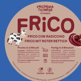
Frico al Radicchio