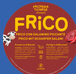
Frico con Salamino Piccante