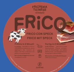
Frico con Speck