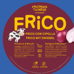
Frico con Cipolla