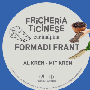
Formadi Frant al Kren