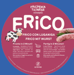
Frico con Luganiga