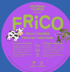
Frico alle Erbe