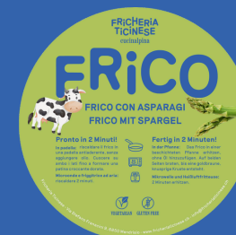
Frico agli Asparagi