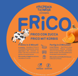
Frico alle Zucca

La Fricheria Ticinese, propone ulteriori tre varianti stagionali ordinabili secondo disponibilità: